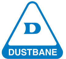
Tableau des finis à plancher

Utilisez ce tableau pour comparer les finis en fonction de leur apparence, de leur durabilité et de leur application. Il vous aidera à choisir les meilleurs finis pour vos besoins d'entretien.